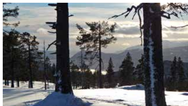
Utsikt mot Krøderen og Norefjell.