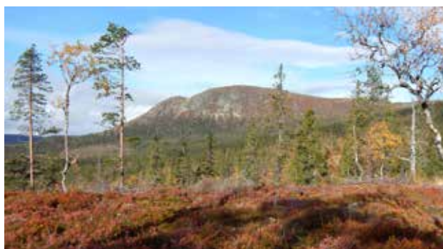
Utsikt fra tomtefeltet mot Sørbølfjell.

Tomter merket med Ålhytta er Ålhytter for prøvebo og salg.